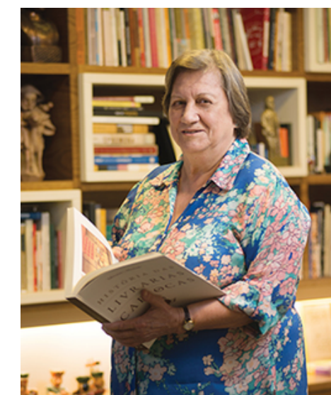
Foto: Magda Soares, educadora, linguísta, pesquisadora e professora universitária brasileira.

Na sequência, foi apresentado o vídeo "O texto como eixo principal na alfabetização e no letramento", no qual são evidenciadas diferentes práticas de leitura e escrita, acompanhadas de comentários e reflexões de Magda Soares, que é Referência em alfabetização no Brasil.