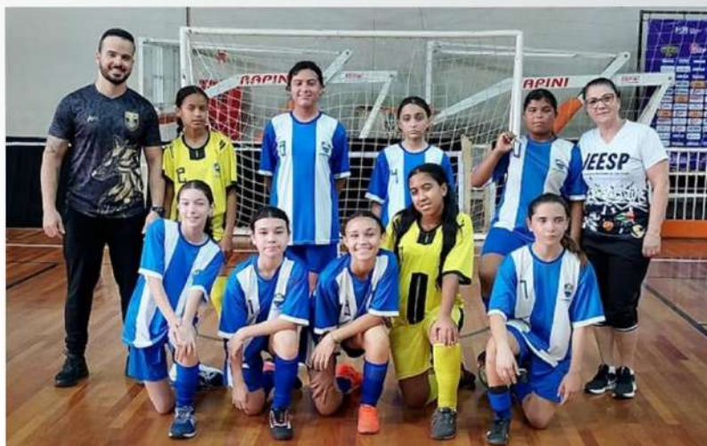
FUTSAL FEMININO - 2º LUGAR: EE NICOLA MARTINS ROMEIRA