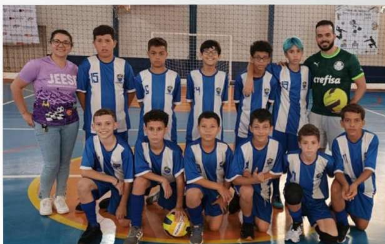
VÔLEI MASCULINO - 1º LUGAR: EE NICOLA MARTINS ROMEIRA