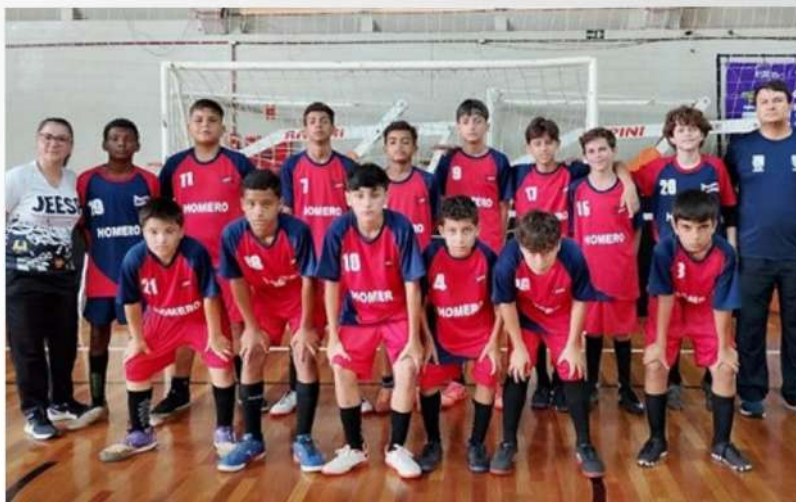
FUTSAL MASCULINO - 3º LUGAR: EE PROF HOMERO CALVOSO