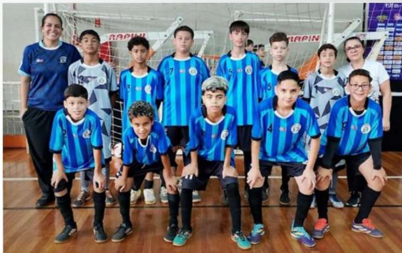
FUTSAL MASCULINO - 1º LUGAR: EE FRANCISCO DUARTE

JEESP Jogos Escolares do Estado de São Paulo, categoria Sub 12 chegando aos finalistas no futsal masculino e feminino e vôlei masculino e feminino. 🏆🏆🏆🏆🏆🏆