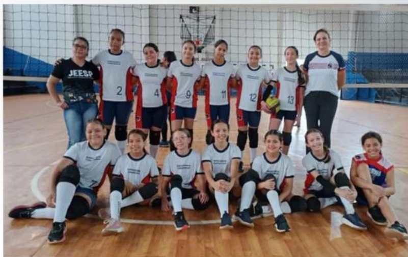
VÔLEI FEMININO - 1º LUGAR: EE SINHARINHA CAMARINHA