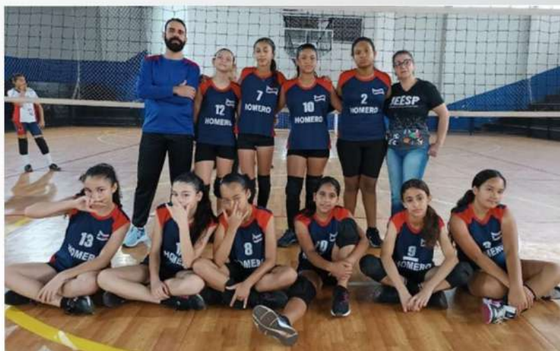
VÔLEI FEMININO - 3º LUGAR: EE PROF HOMERO CALVOSO

Participando dos JEESP nossos alunos aprendem: o trabalho em equipe, o espírito esportivo e o respeito às regras do jogo, aprendem a lidar com vitórias e derrotas, a importância da cooperação e a desenvolver habilidades sociais, como a comunicação e a tomada de decisões em grupo. 🏐👊👏👏