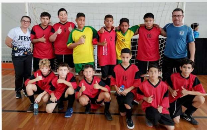
FUTSAL MASCULINO - 2º LUGAR: EE PROF NORIVAL VIEIRA DA SILVA