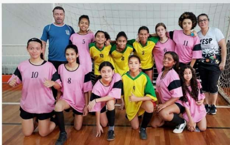
FUTSAL FEMININO - 1º LUGAR: EE PROF NORIVAL VIEIRA DA SILVA