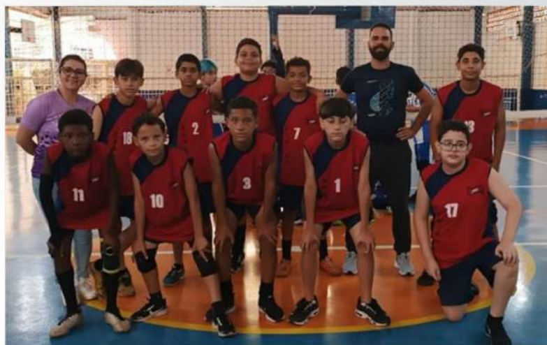
VÔLEI MASCULINO - 2º LUGAR: EE PROF HOMERO CALVOSO