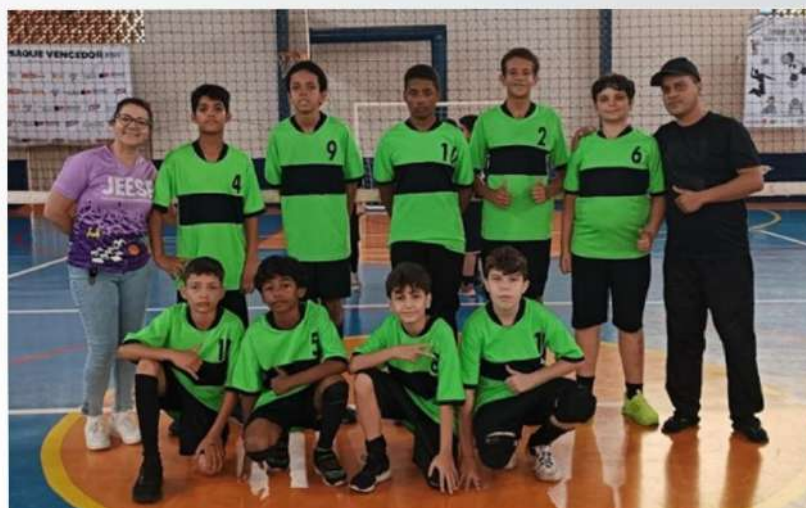
VÔLEI MASCULINO - 3º LUGAR: EE PROFª JUSTINA DE OLIVEIRA CONÇALVES