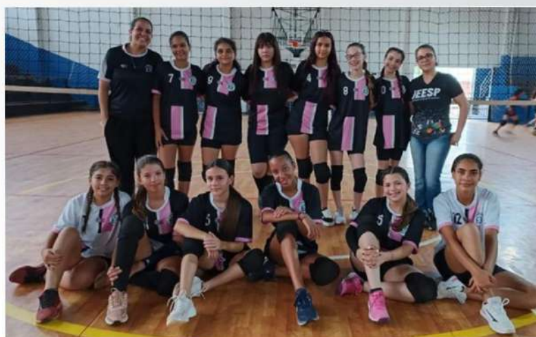
VÔLEI FEMININO - 2º LUGAR: EE FRANCISCO DUARTE