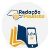
Profs. Redação e Leia SP - 2024 Convite para grupo do WhatsApp

https://chat.whatsapp.com/EI06y2ybzuYBefXm0Y53IF