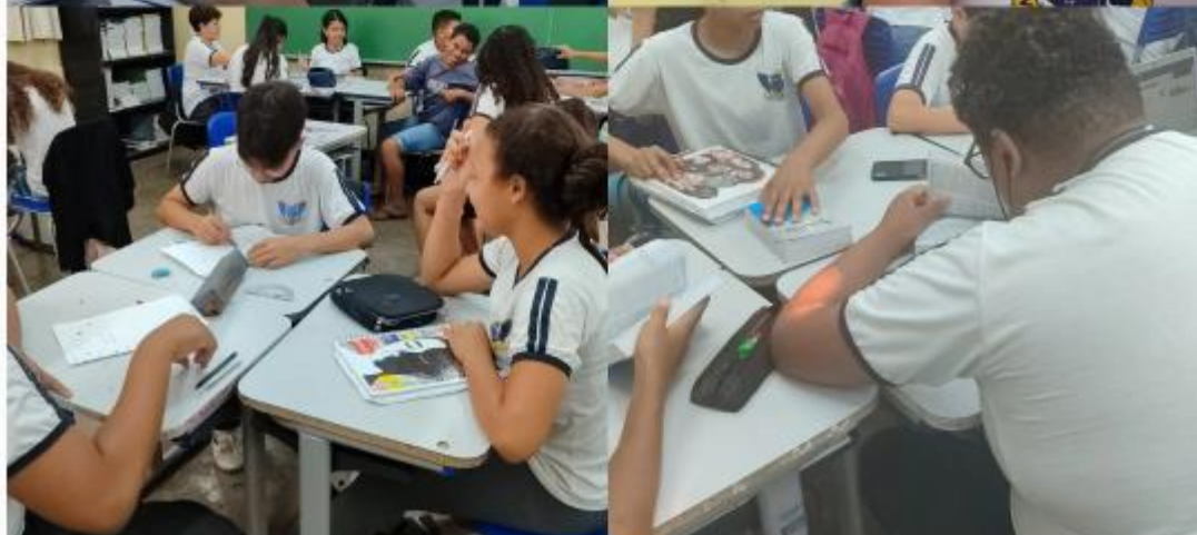
Alunos do 7º ano A