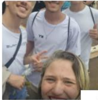
PEI EE Prof Cid de Oliveira Leite Dia-03/11/24 Acolhimento ENEM/24