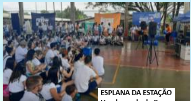
ESPLANA DA ESTAÇÃO Hamburgada do Bem