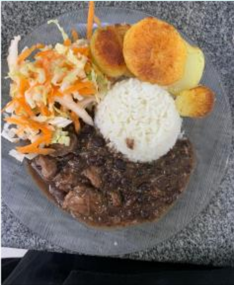
EE Otoniel Mota