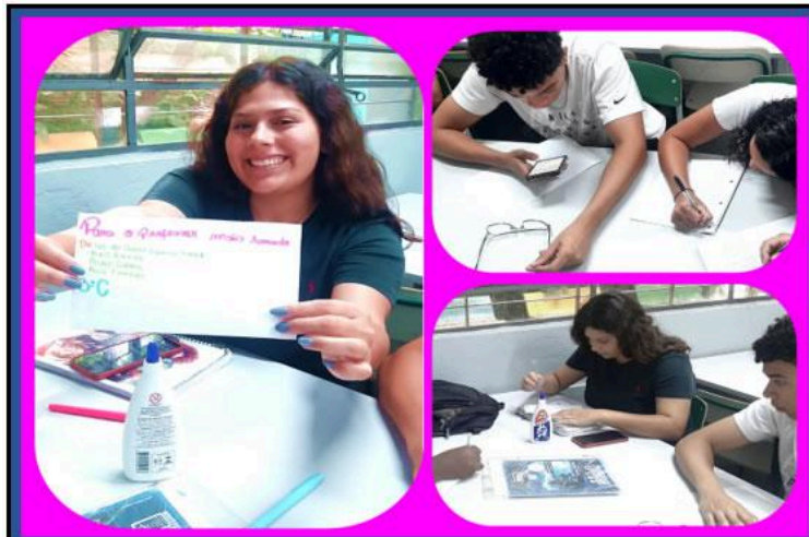
Os alunos começaram a escrever suas cartas, alguns escreveram rascunhos, outros enfeitavam as cartas.