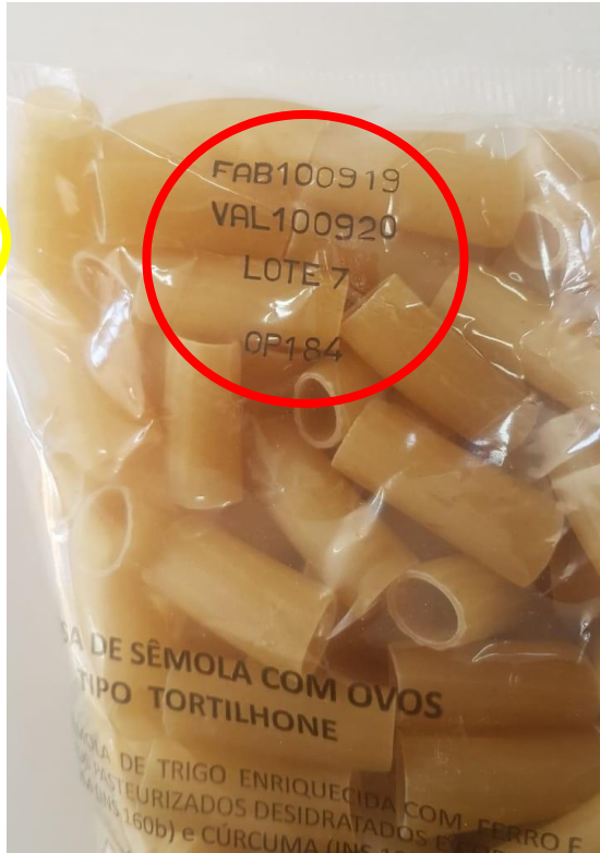
IDENTIFICAÇÃO: PRODUTO, MARCA, LOTE, VALIDADE