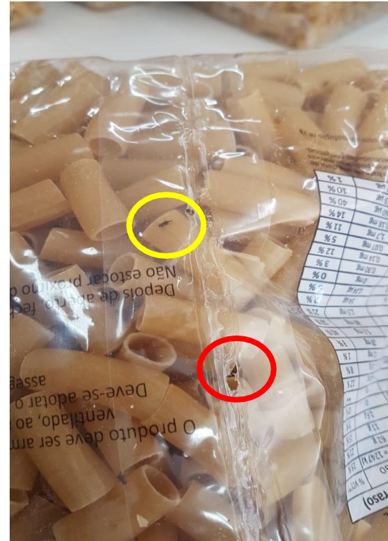
PROBLEMA COM O PRODUTO