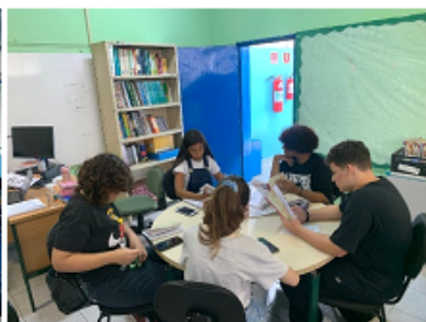
Estudos na hora do almoço