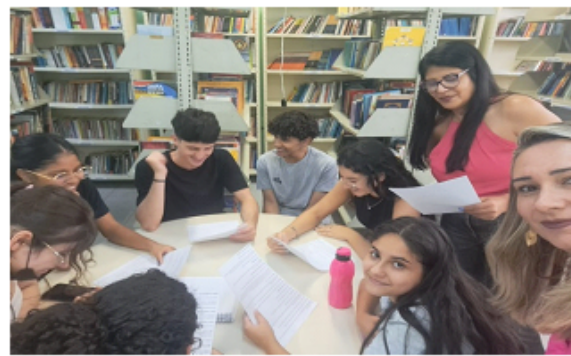
Montagem do roteiro, escolha dos personagens e narrador