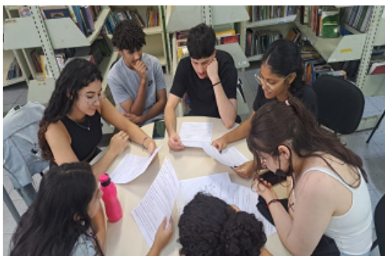
Ensaios da Radionovela – A Cartomante