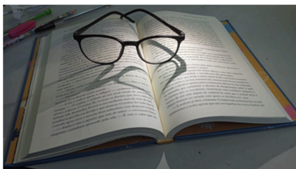
3 - sombra e refração / amor a leitura