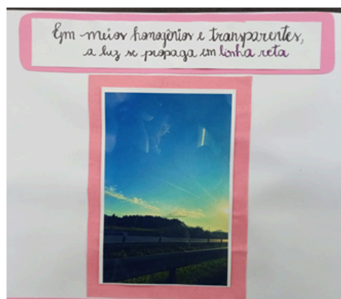
Organização das fotos por propriedades da luz.