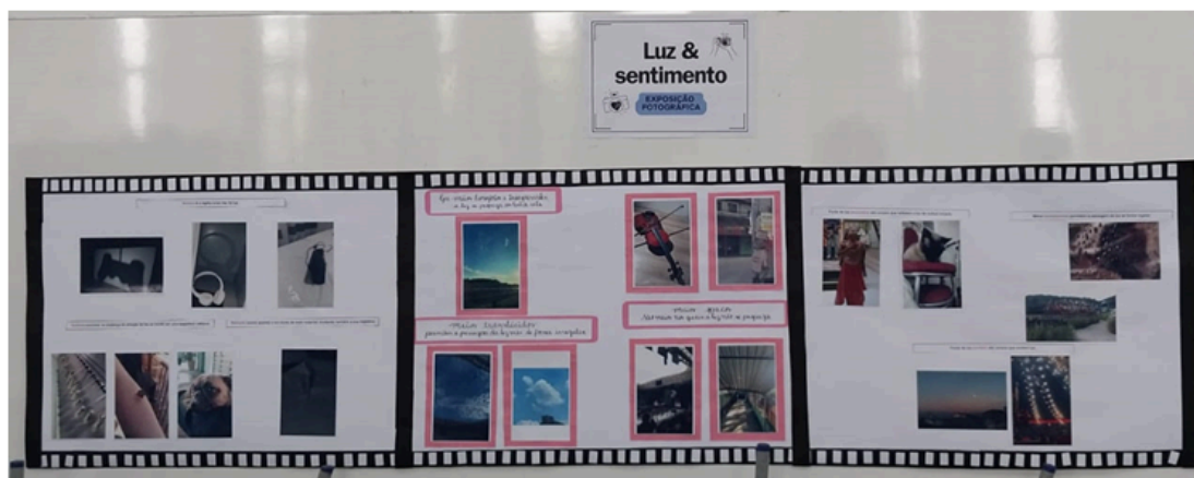
Painel de exposição com as fotos.

Arquivo recebido em: 25/07/2024 15:58:24