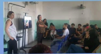
Ação Grêmio Estudantil e Comissão Direitos Humanos