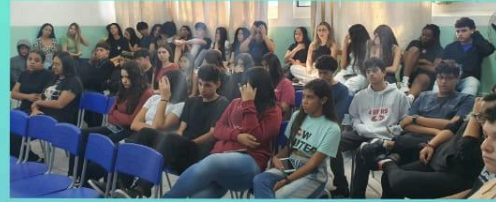
Palestra SOS Rio Grande do Sul 10/05/2024