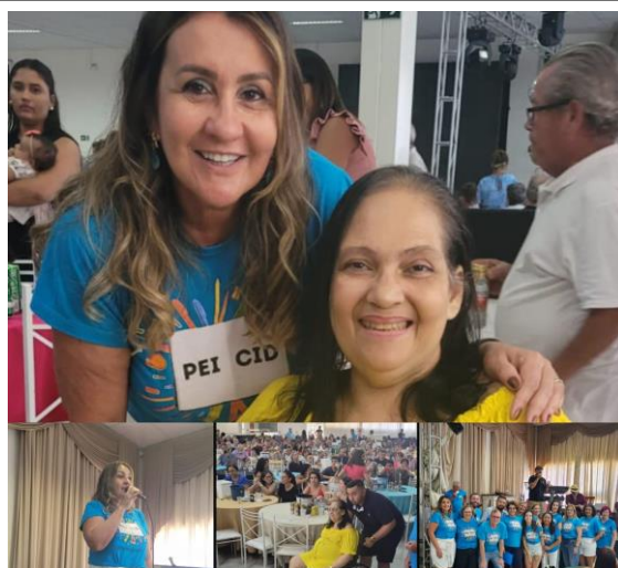
Doação de cadeira de rodas pela E.E Cid de Oliveira Leite e ONG Caminhando com amor