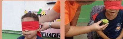
Aula de Práticas experimentais da E.E Geraldo Tristão de Lima