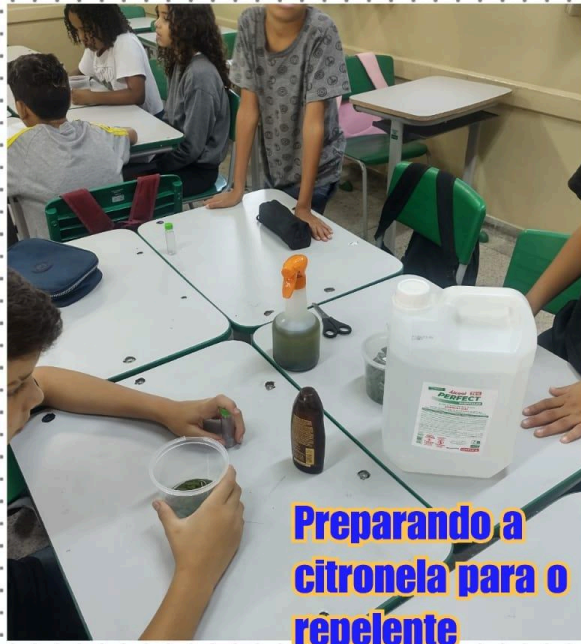
Preparando a citronela para o r epelente