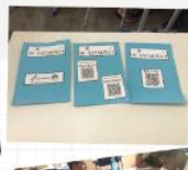
Atividade de rotação por estação sobre a temática Dengue, sendo desenvolvida durante a tutoria.