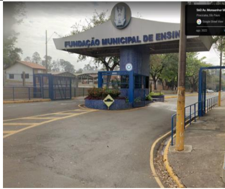
Entrada da Fumep