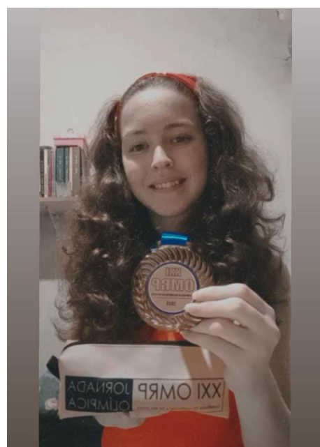
Medalha de Bronze