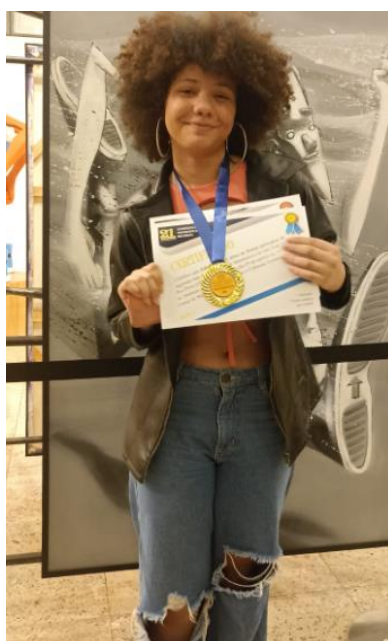
Medalha de Ouro

Agradecemos o apoio de todos os envolvidos para que nossos alunos tivessem a oportunidade de participar!