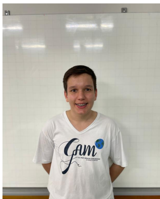
Medalha de Prata