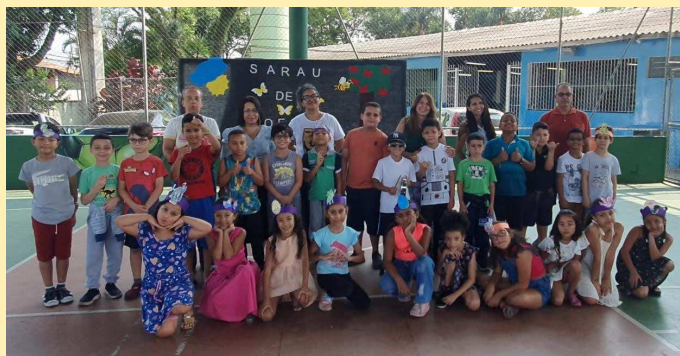
Alunos do 2º ano A recebem aplausos dos colegas.