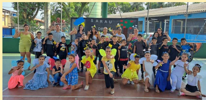
Alunos do 2º C homenagearam Vinícius de Moraes.