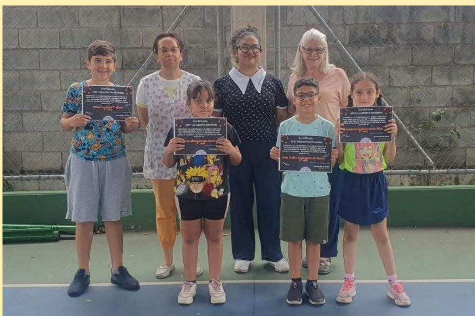
Professoras entregam certificado aos alunos vencedores.