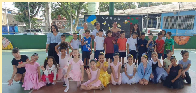
Alunos do 2º ano B homenagearam Cecília Meireles.