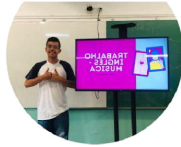
Activity-3B Momento de exposição da entrevista sobre as músicas e artistas favorito ...