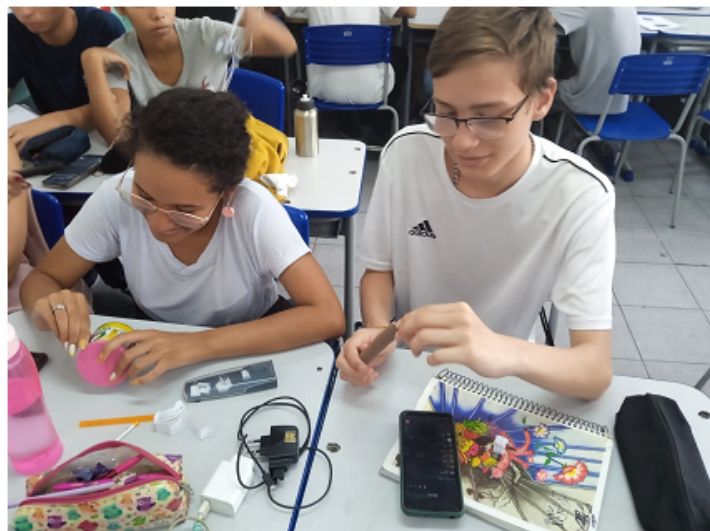
Montagem do equipamento