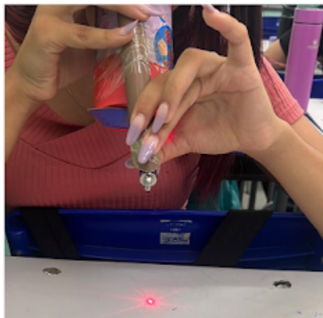
Testando o equipamento