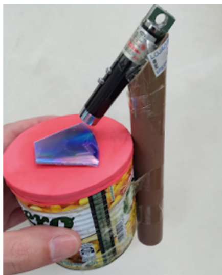
Equipamento pronto (Materiais: lata, bexiga, CD, laser, cano)