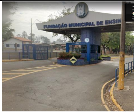
Entrada da Fumep