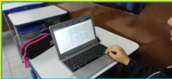
Turma: 3ª série C | Profª Elieth Carvalho