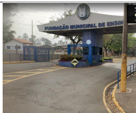
Entrada da Fumep

A formação será realizada no Bloco 9 (Laboratório 7). Segue mapa para chegar ao bloco 9 de carro: