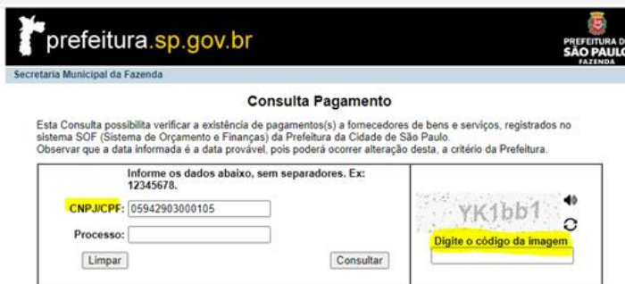
Imagem 3: captura de tela da consulta de pagamento.

Caso a empresa tenha recebido algum pagamento registrado no sistema SOF (Sistema de Orçamento e Finanças) da Prefeitura de Cidade de São Paulo, será apresentada uma lista de pagamentos realizados, vide exemplo: