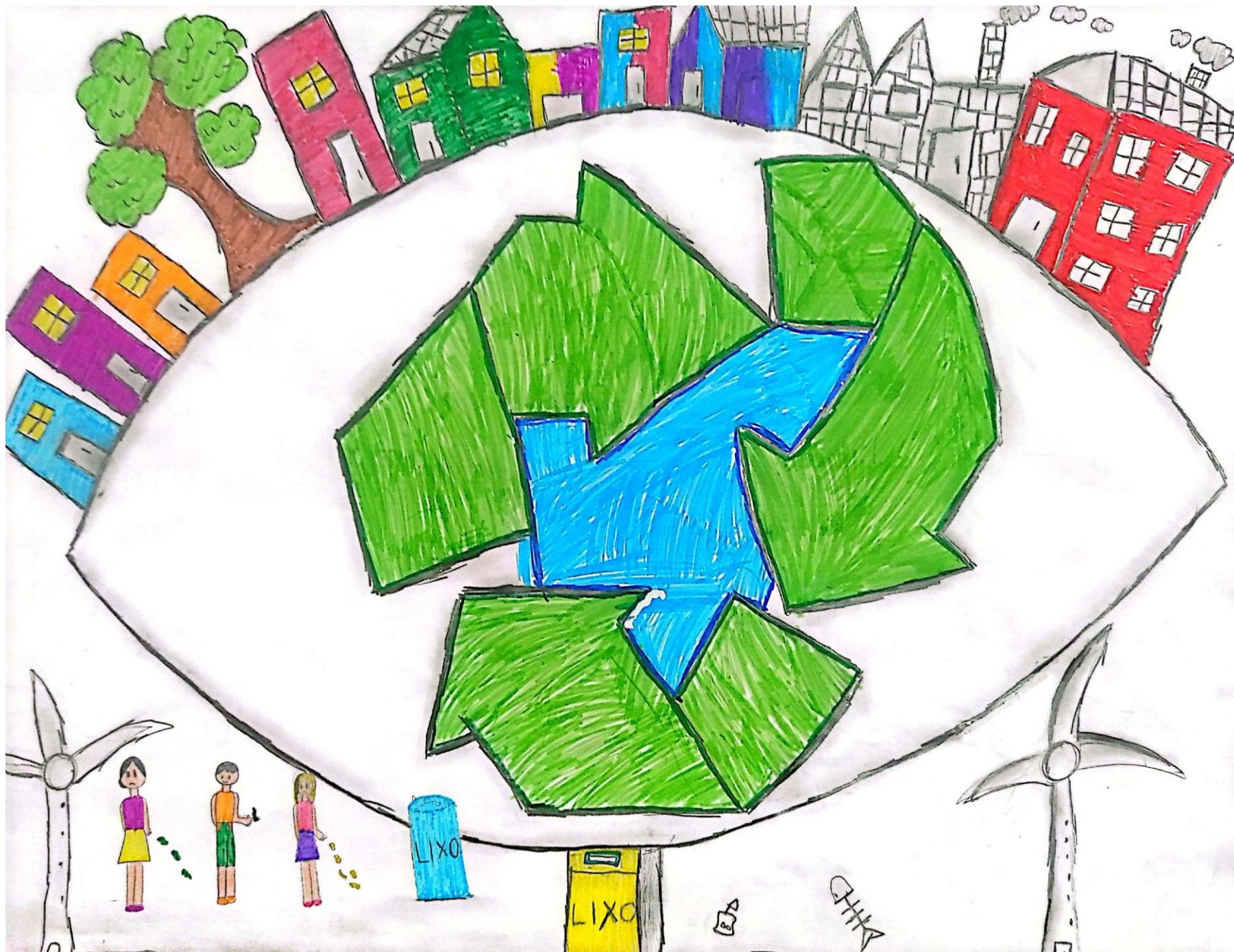
DESENHO CLASSIFICADO – FASE DIRETORIA EE PROFESSOR ROBERTO Veltre – ANOS INICIAIS