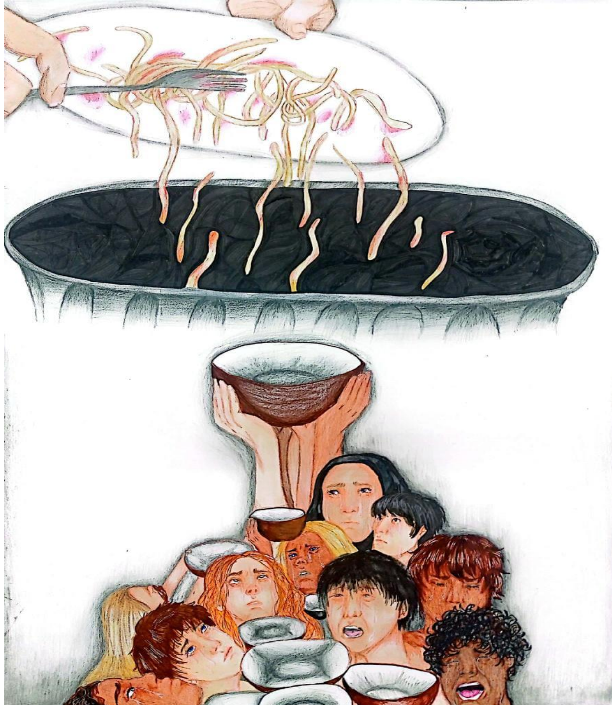
DESENHO CLASSIFICADO – FASE DIRETORIA EE JOÃO MANUEL DO AMARAL – ANOS FINAIS