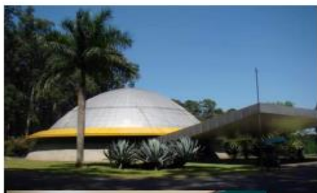
Foto: Planetário do Ibirapuera; fonte: https://parquedoibirapuera.org

O que ver e fazer: https://parqueibirapuera.org/coisas-para-ver-e-fazer/