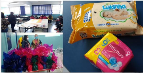
E.E. JARDIM DAS ROSAS