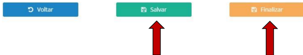
Figura 4: Após o término do preenchimento, é necessário “Salvar” e “Finalizar”.