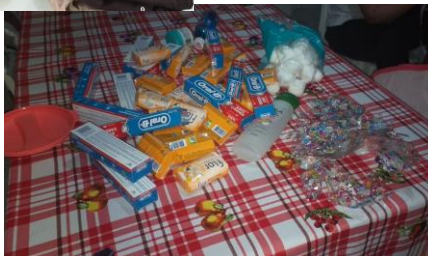
Foto 1- Busca ativa in loco Foto 2- Organização e montagem dos kits Fotos 3 e 4 - Atendimento ao aluno, aula síncrona – Ângela, PA do PEF e professora semana letiva.