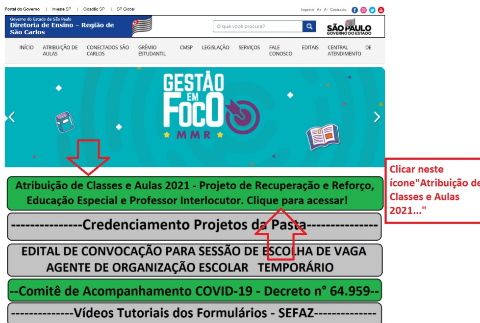
Imagem 01: Clicar em Atribuição de Aulas para orientações e links.

Em seguida será exibida a seguinte página: Imagem 02: Clicar em Saldo de Aulas