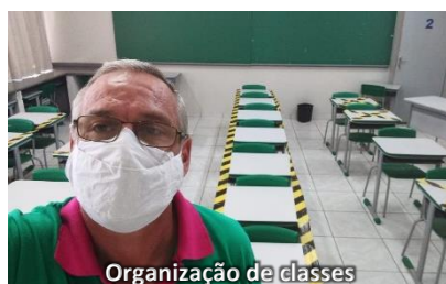
Organização de classes