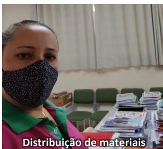
Distribuição de materiais