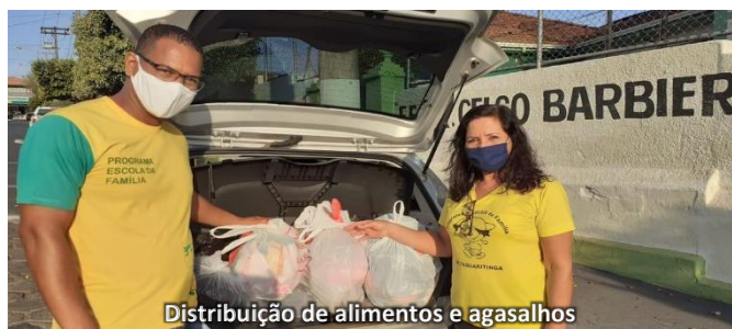
Distribuição de alimentos e agasalhos