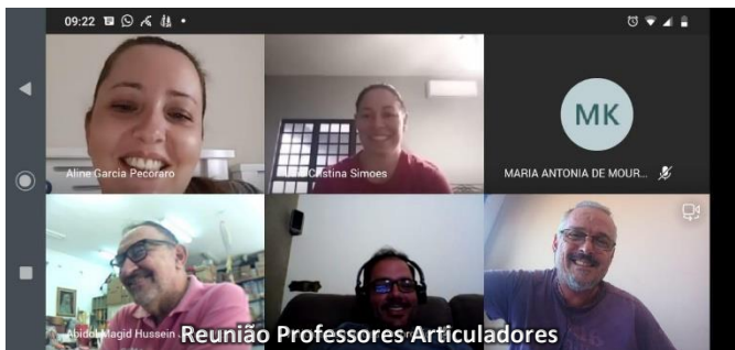
Reunião Professores Articuladores