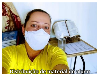
Distribuição de material do aluno