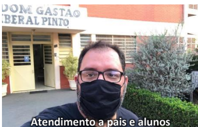
Atendimento a pais e alunos