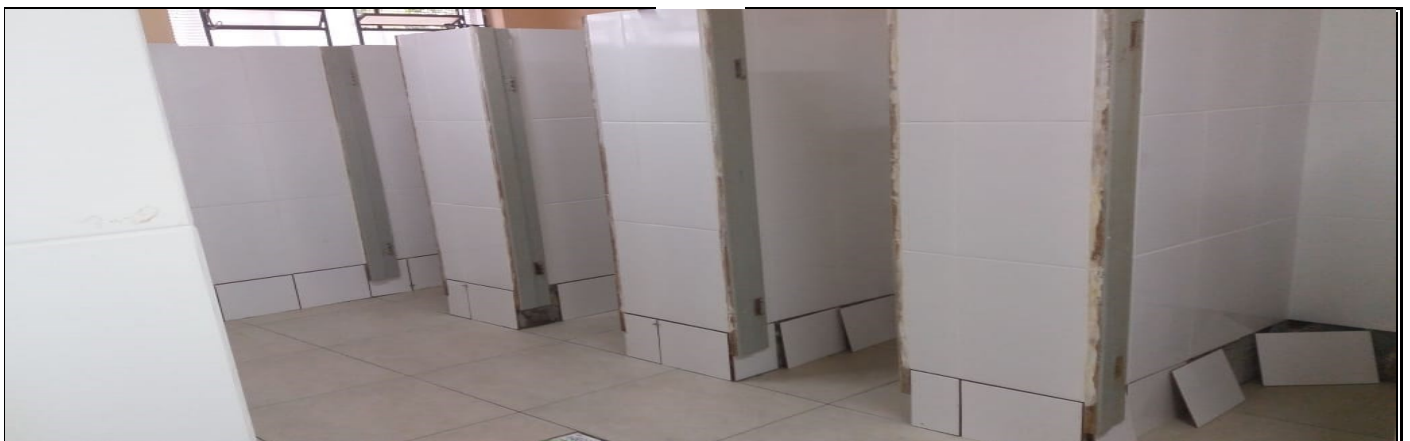
REFORMA DO SANITÁRIO DO GINÁSIO DE ESPORTES