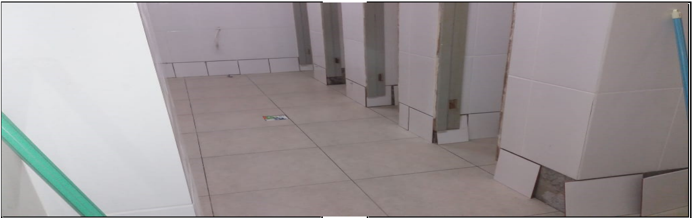
REFORMA DO SANITÁRIO DO GINÁSIO DE ESPORTES