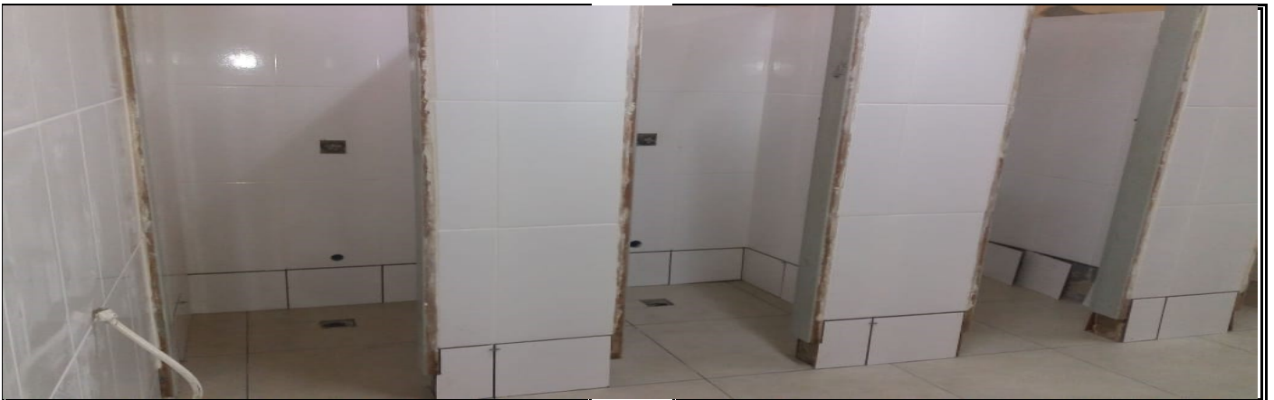
REFORMA DO SANITÁRIO DO GINÁSIO DE ESPORTES