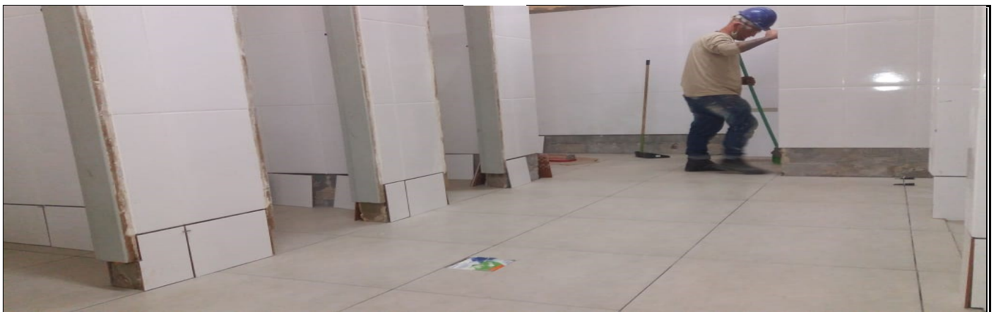
REFORMA DO SANITÁRIO DO GINÁSIO DE ESPORTES