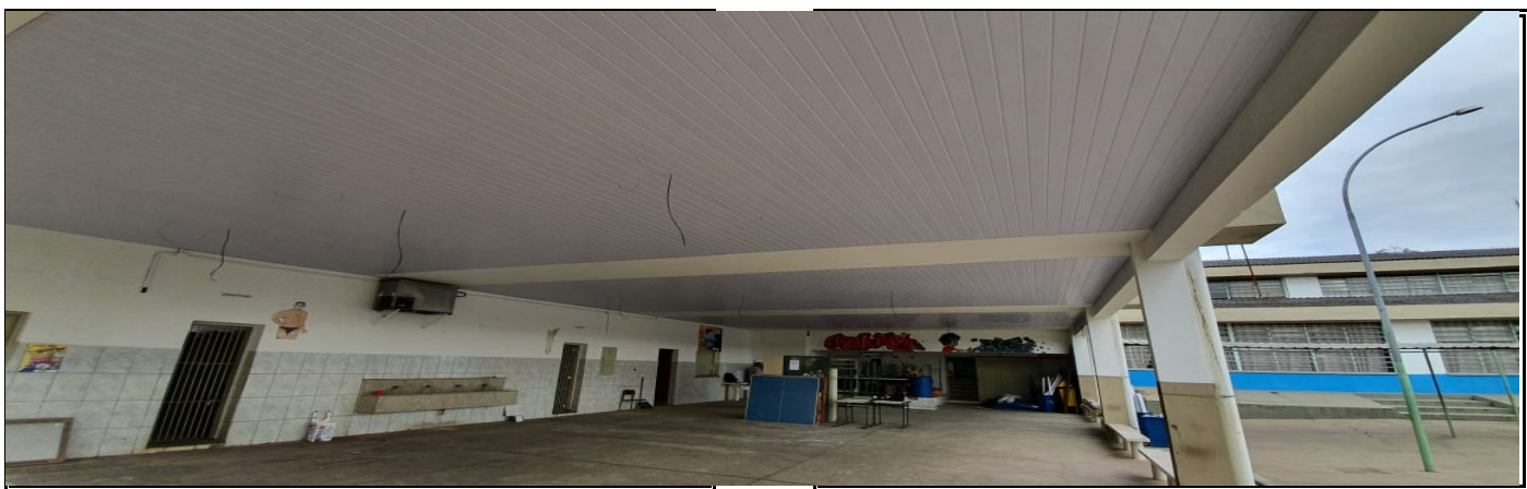
COLOCAÇÃO DE FORRO NO PÁTIO COBERTO PARA EVITAR POMBOS