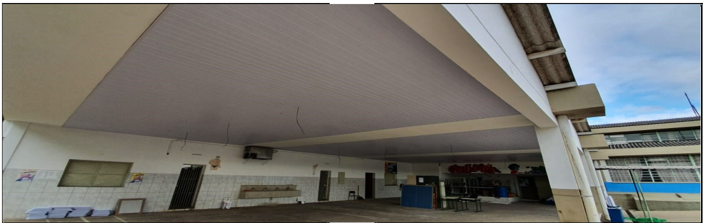
COLOCAÇÃO DE FORRO NO PÁTIO COBERTO PARA EVITAR POMBOS