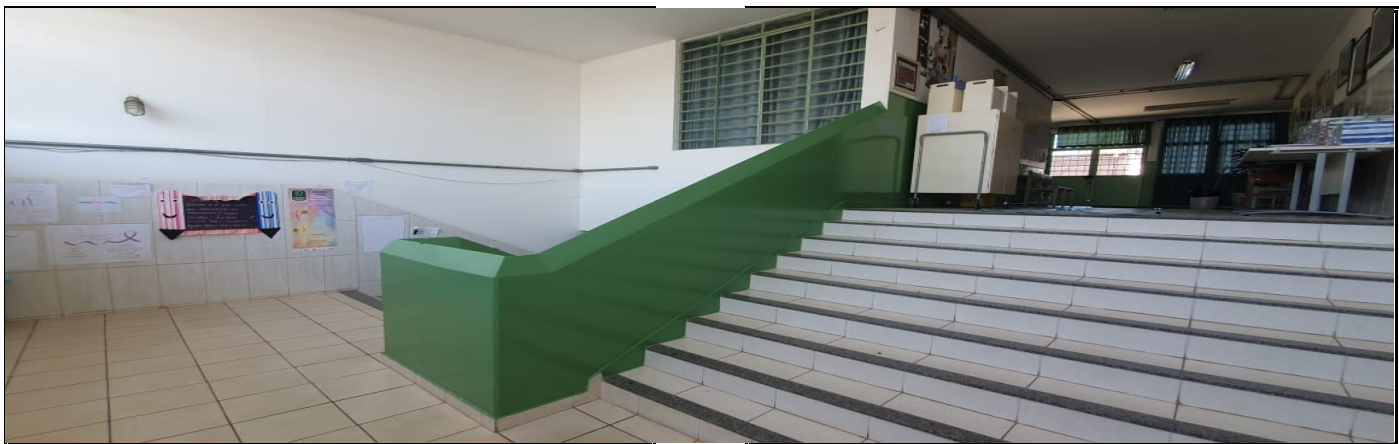
PINTURA DOS AMBIENTES