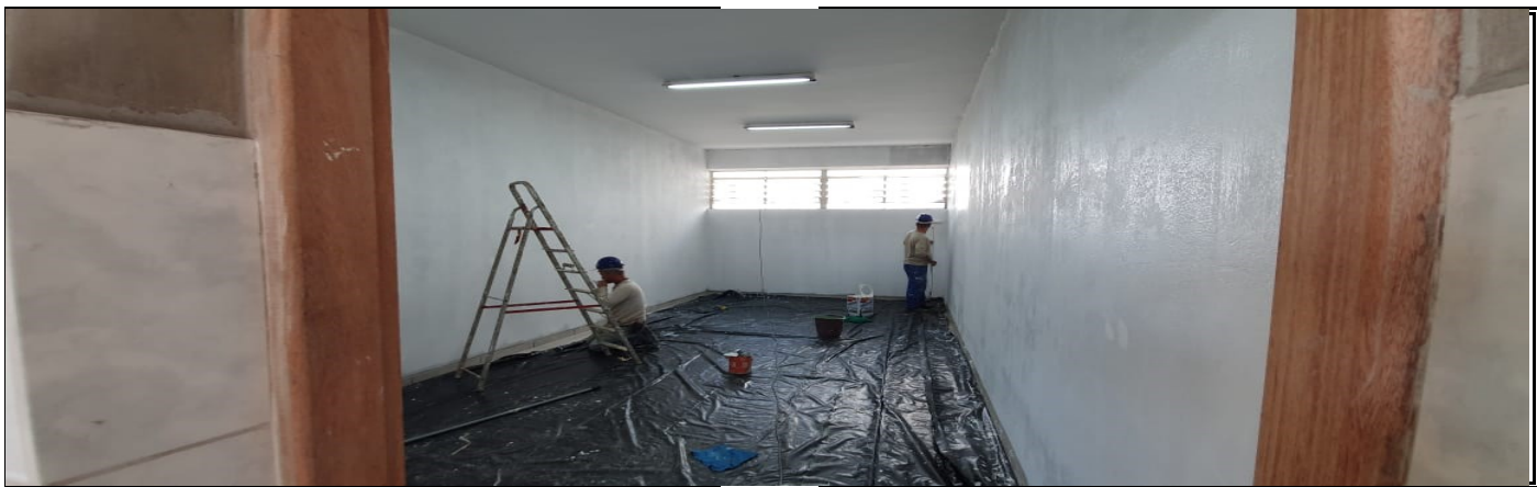
ADEQUAÇÃO SALA DE LEITURA