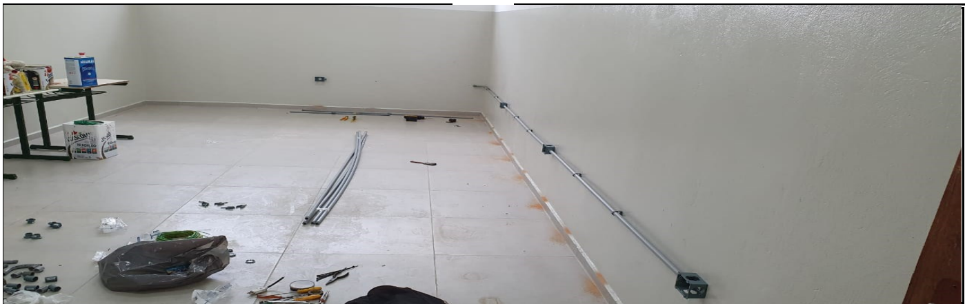
ADEQUAÇÃO SALA DE LEITURA