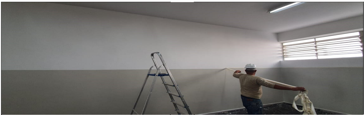
ADEQUAÇÃO SALA DE LEITURA