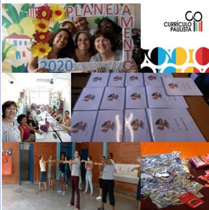
E.E. Jardim Canaã

Semana de Planejamento, atividades de relaxamento, apresentação do currículo e mimos para toda equipe.