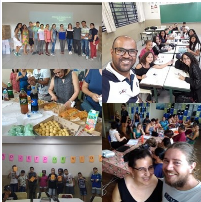
E.E. Brigadeiro Gavião Peixoto