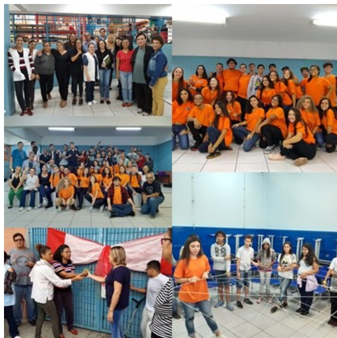
E.E. Profa. Anilza Pioli

Foi realizado um momento solenidade do início do programa de Ensino Integral com acolhimento dos alunos das E.E. Prof. Milton da S. Rodrigues e E.E. Profa. Ana S. da Silva.