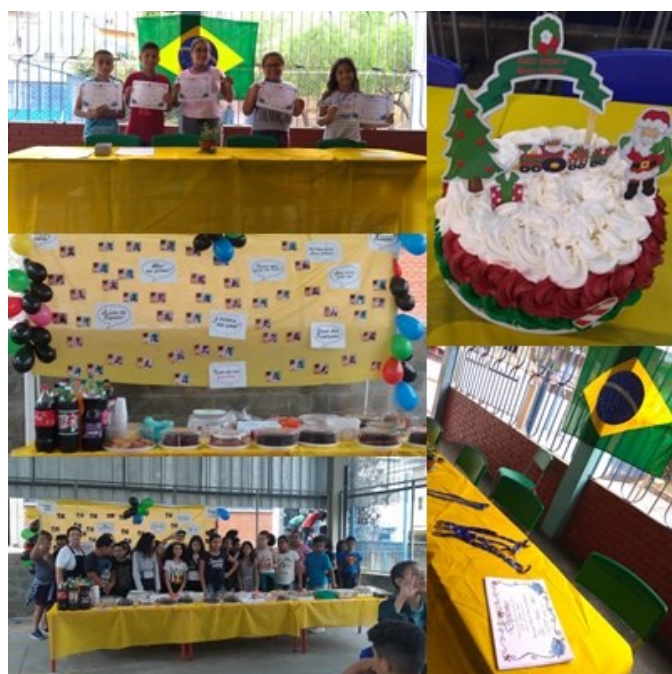
E.E. Jardim Canaã

Festa de Natal na E.E. Prof. Geraldo Homero de França Ottoni foi repleto de emoção e surpresas.