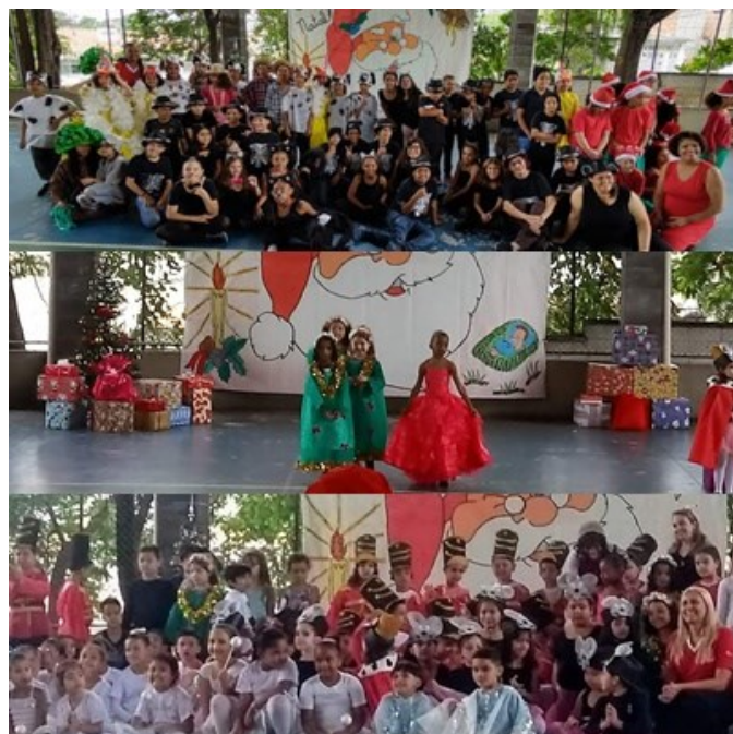
E.E. Prof. Raul Antônio Fragoso