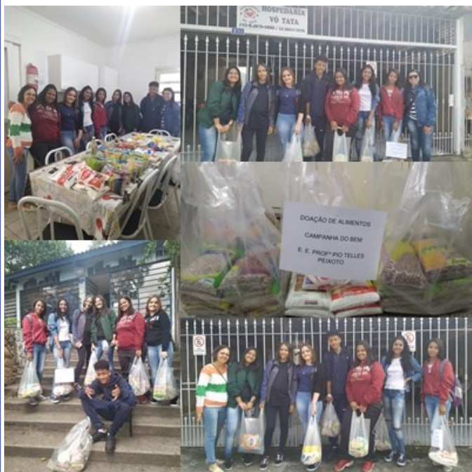
E.E. Prof. Pio Telles Peixoto