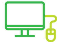
Figura 1.B – Acessos no AVA