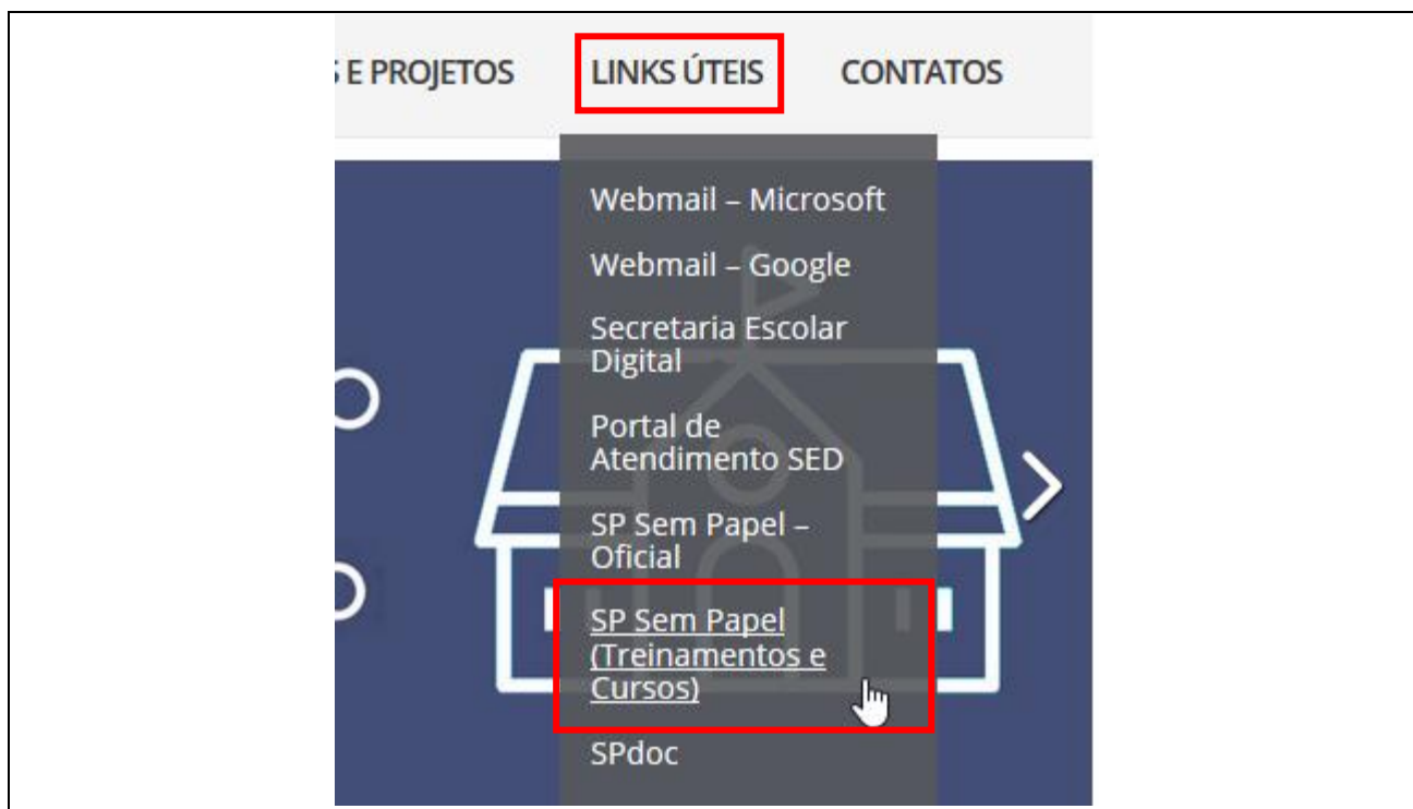
Figura 1.A – Acesso ao ambiente de treinamento (AVA) do SP Sem papel

Para acessar o Ambiente virtual de Aprendizagem (AVA) do SP Sem Papel utilize o endereço < https://treinamentos.spsempapel.sp.gov.br/ > ou o atalho pelo site da Diretoria de Ensino Região Mogi das Cruzes < https://demogidascruzes.educacao.sp.gov.br/ > em “LINKS ÚTEIS” → “SP Sem Papel (Treinamentos e Cursos)” (Figura 1.A):