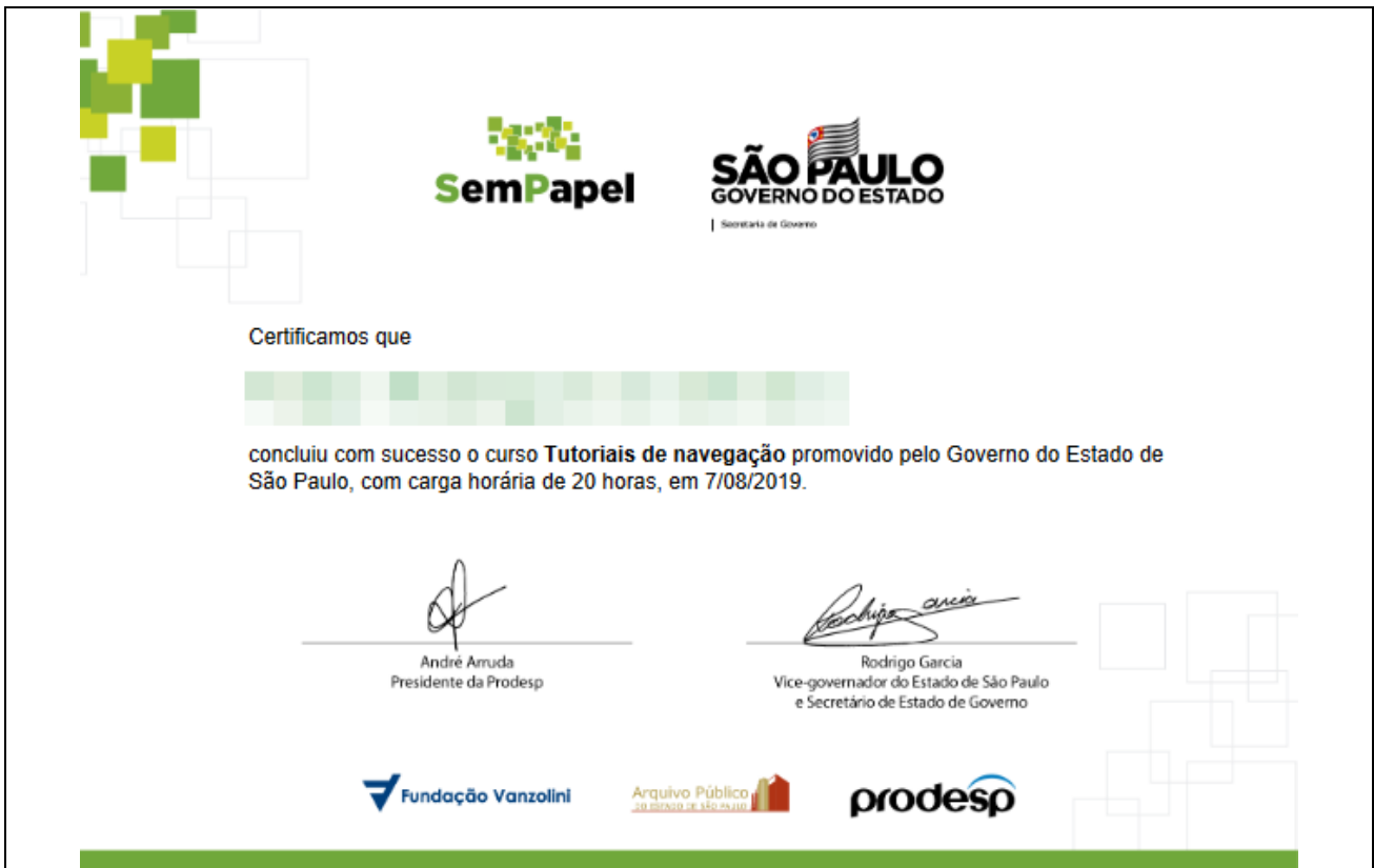
Figura 1.C – Certificado para o curso de Tutoriais de navegação