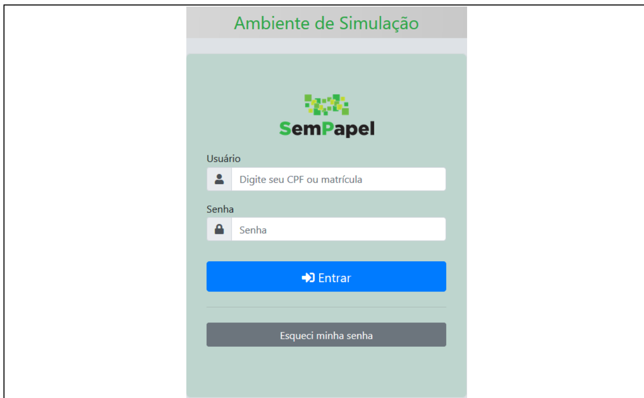
Figura 1.F – Página de login para o ambiente de simulação

Utilize um dos usuários listados e a senha padrão Seduc@1020 (Figura 1.F).