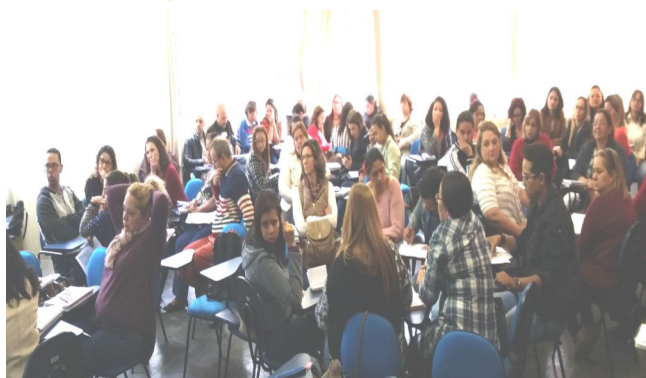
PC em formação

Nesse segundo encontro, os Professores Coordenadores foram expostos à reflexão sobre avaliação com os objetivos de: enriquecer a compreensão sobre o real sentido da avaliação educacional e conhecer os seus objetivos; saber formar e orientar o professor para elaborar a avaliação para a turma; conhecer os pressupostos teóricos que fundamentam a avaliação educacional; conhecer os limites e possibilidades da avaliação escolar; aprender diferentes estratégias para uma avaliação formativa focando em conhecer as recomendações técnicas e pedagógicas a serem consideradas na elaboração de bons itens, participar de atividades práticas que contribuirão para a construção de itens na elaboração das avaliações.