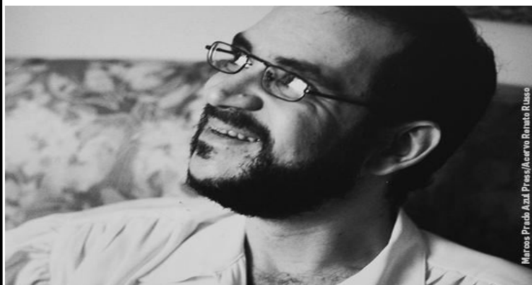
Marcos Prub Azul Press/Agência Renato Russo

Acesse o site do MIS e veja a programação completa.