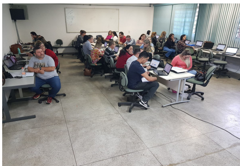
Professores Coordenadores de Cotia e Carapicuíba presentes na formação.