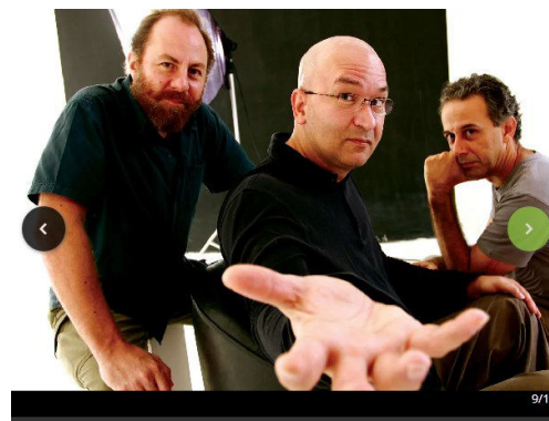
Os Paralamas do Sucesso fecham a programação do palco História do Rock, no Copan, às 16h30 do dia 20

Parabéns aos aniversariantes do mês de maio!!! Lembrem-se de realizar o Recadastramento Anual. Acessem o endereço: