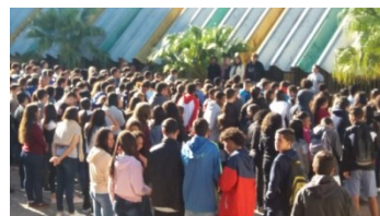
Feira de Ciências E.E. Anthenor Fruet.