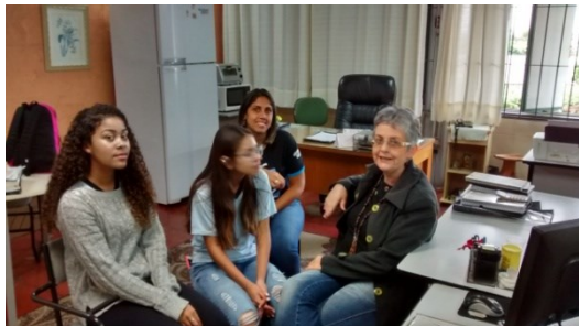
Orientações ao projeto selecionado para FeCEE-SP 2018-2019. E.E. Anthenor Fruet.

SECRETARIA DE ESTADO DA EDUCAÇÃO DIRETORIA DE ENSINO – REGIÃO ITU Praça Almeida Jr, 10 – Vila Nova – Itu – SP - CEP 13309-049 Fone: (11) 4813-7600 Fax: (11) 4813-7627 e-mail: deitu@educacao.sp.gov.br