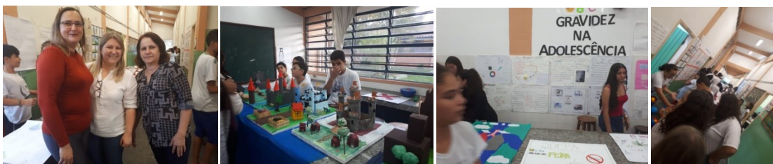
Feira de Ciências E.E. Acylino do Amaral Gurgel.

Parabenizamos a todos pelo empenho e belas apresentações!!! Aguardamos vocês na Feira de Ciências Regional!!!