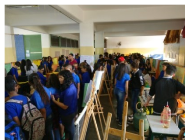
Feira de Ciências E.E. Benê Teixeira da Fonseca do Amaral Gurgel.