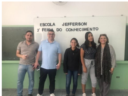
Feira de Ciências E.E. Jeferson Soares de Souza.

SECRETARIA DE ESTADO DA EDUCAÇÃO DIRETORIA DE ENSINO – REGIÃO ITU Praça Almeida Jr, 10 – Vila Nova – Itu – SP - CEP 13309-049 Fone: (11) 4813-7600 Fax: (11) 4813-7627 e-mail: deitu@educacao.sp.gov.br