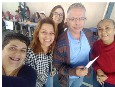
Feira de Ciências E.E. Mirinha Tonello.