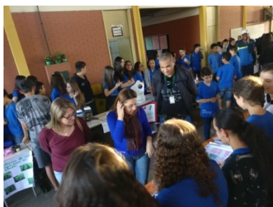
Feira de Ciências E.E. Pery Guarany Blackman.