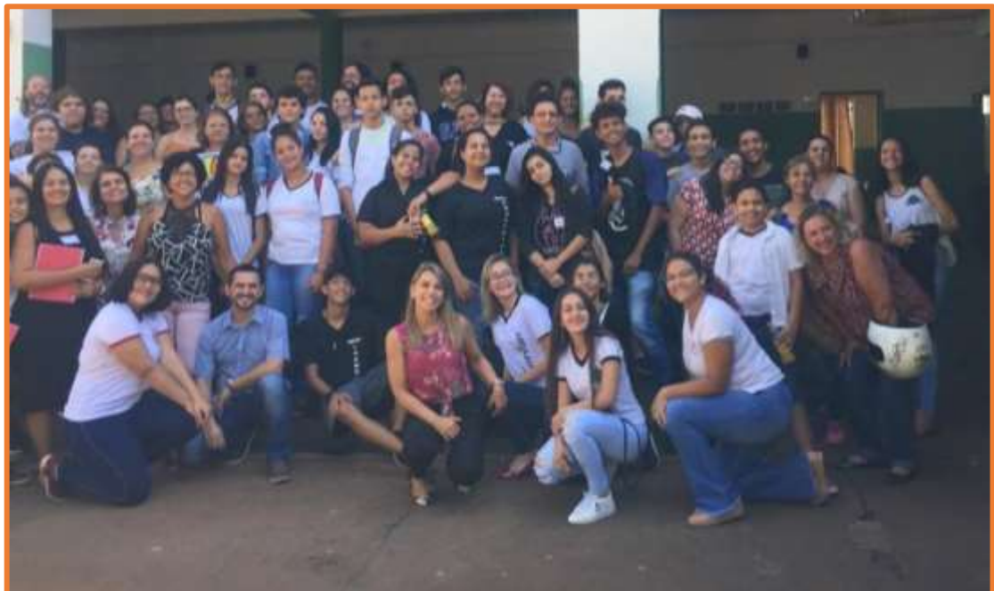
Alunos e Interlocutores que participaram do Encontro presencial dos Grêmios Estudantis realizado na E. E. Winston Churchill – Polo Sertãozinho