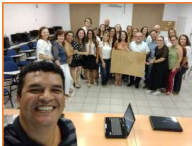
Reunião do MMR na Diretoria de Ensino com Dirigente, PCNPs e Supervisores