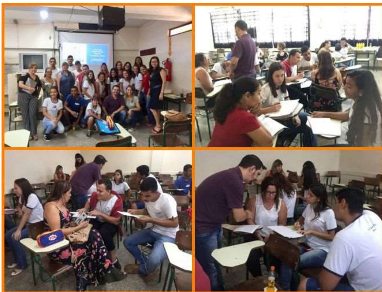
Encontro Presencial do Grêmio Estudantil na E. E. Maria Falconi de Felício Polo Pitangueiras

Esperamos que as chapas vencedoras do ano de 2019 sejam atuantes e façam a diferença nas unidades escolares, como vozes representantes de todos os alunos, garantindo o direito de participação e atuação destes nas decisões que envolvem toda a comunidade escolar.