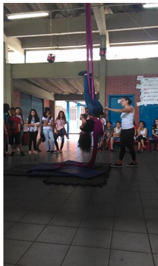
Professores e alunos acompanhando e participando da oficina de acrobacia aérea em tecido Equipe supervisionando os deslocamentos dos alunos para as oficinas