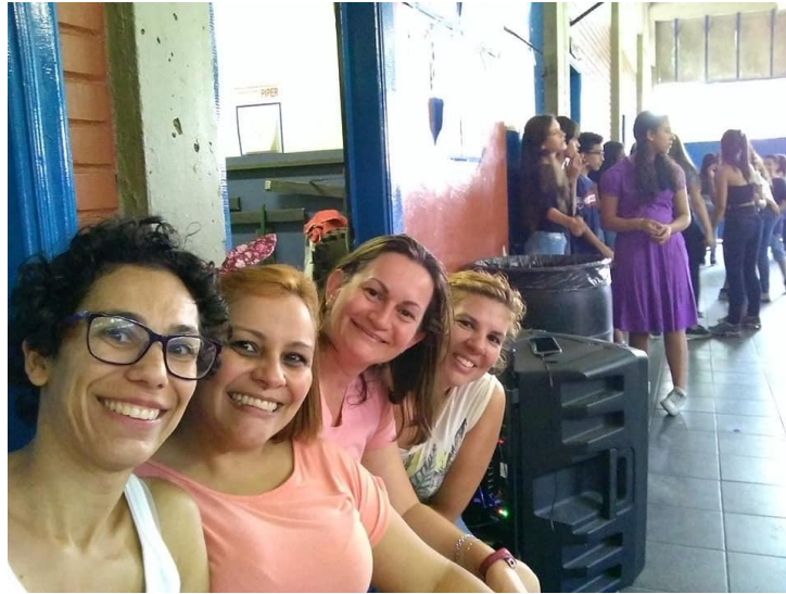
Aula prática no pátio