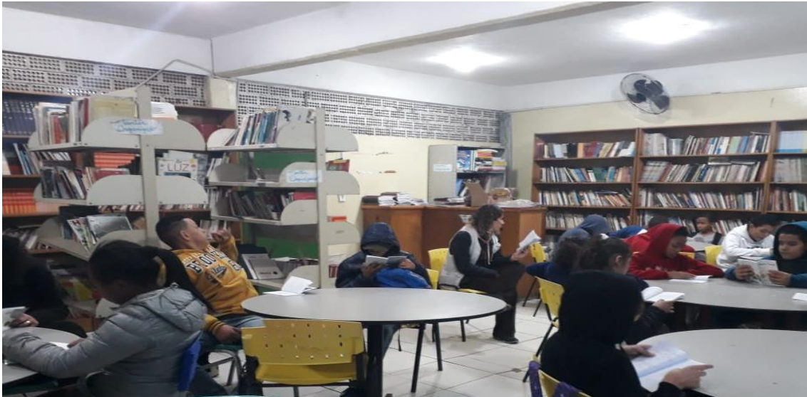
Alunos dos 6º anos A e B, participando do Projeto Pequeno Príncipe na Sala de Leitura.