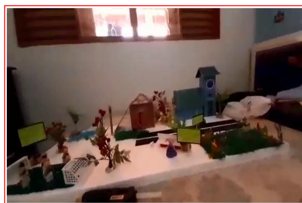
Produção da aluna Nara Carolina Stahl Pella - 1ª série B