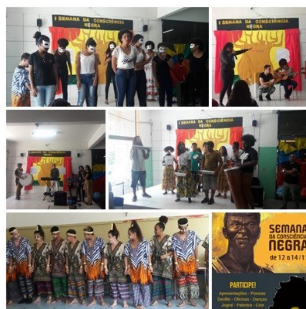
E.E. Florestan Fernandes