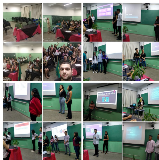
E.E. Clodomiro Carneiro