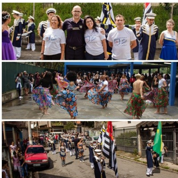
E.E. Prof. Sebastião de Oliveira Gusmão