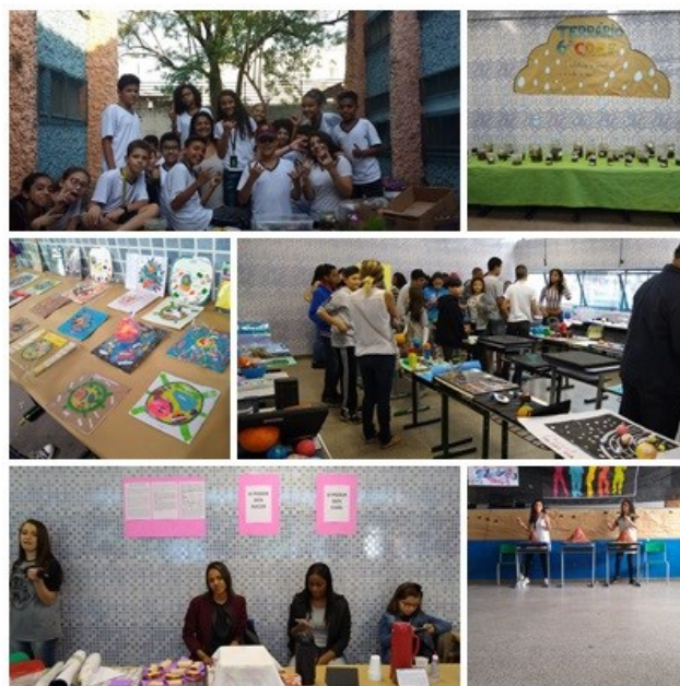
E.E. Gal. Humberto de Souza Mello

Ação Escola da Família: Cartinhas para o Papai Noel, adote uma carta e faça uma criança feliz neste Natal.