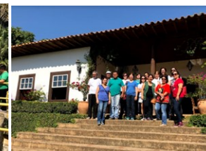
APA Pedregulho – Fazenda Capoava