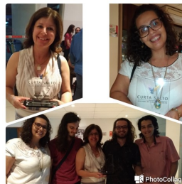
Premiação do V Curta-Salto.