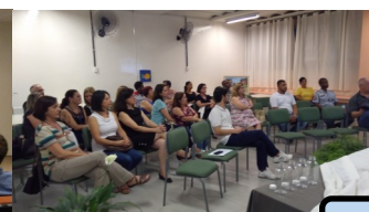
Simpósio em Itu - NPE