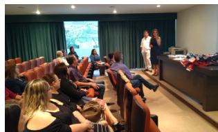
Simpósio Saúde e Educação Município de Salto

Em novembro, com a finalidade de encerrar as ações do Curso, organizamos em parceria com as Secretarias de Saúde e Educação dos Municípios de Itu e Salto dois Simpósios com o tema: “Como fortalecer a parceria Saúde e Educação” com o objetivo de discutir o pleno bem estar físico, mental e social dos profissionais e dos alunos envolvidos na proposta, bem como proporcionar maior integração intersectorial para potencializar as ações preventivas nas Unidades Escolares. Parabenizamos e agradecemos a todos os participantes pelo engajamento e ótimas oportunidades de trocas de experiência!!!!