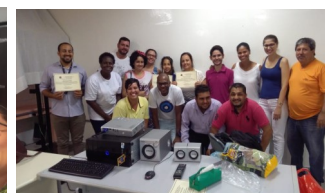
Polo Itu: Saúde Visual e Auditiva