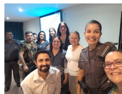
Polo Salto: Prevenção a Violência