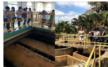
Visita a ETA