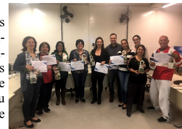
Encerramento do curso com a entrega de certificados e mudas de plantas cedidas pela Secretaria do Meio Ambiente de Itu.