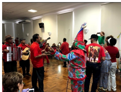
Apresentação do Grupo de Folta de Reis Estrela do Oriente.