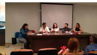
Mesa Redonda - Auditório Paulo Freire - Salto