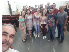
Encerramento do Curso.