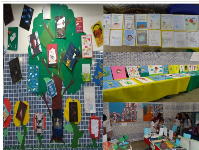
E.E. General Humberto de Souza Mello Mostra Literária - Setembro/2018