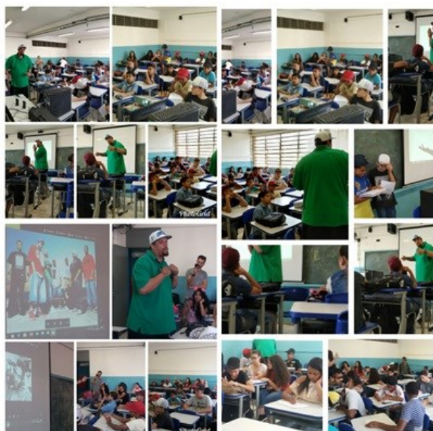
E.E. República da Argentina