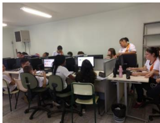
Sala de Informática - Geometria