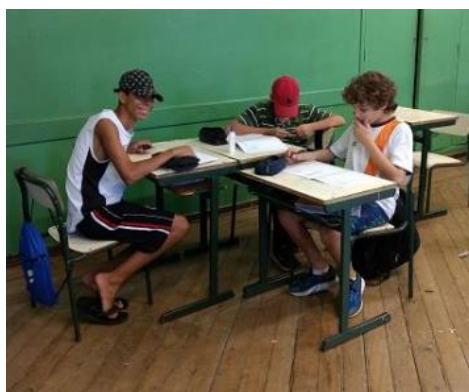
AAP – Correção com grupo colaborativo