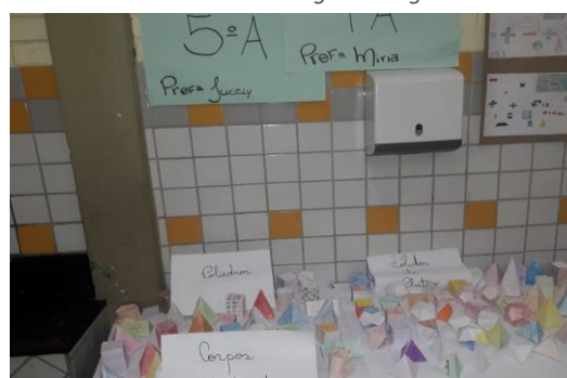
Figura 5 Sólidos Geométricos