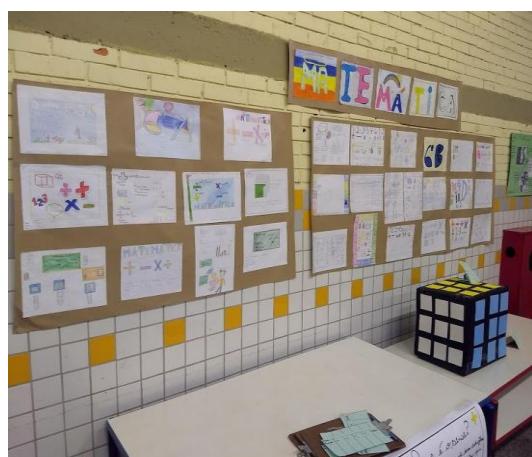
Figura 2 Stop da tabuada e Painei