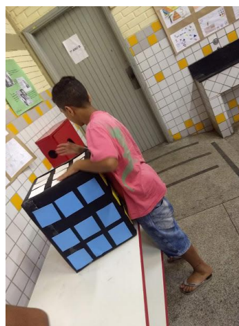
Figura 3 Jogo do Cubo