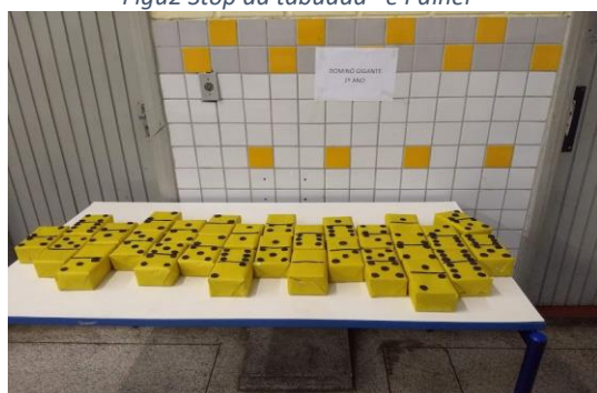
Figura 4 Dominó Gigante