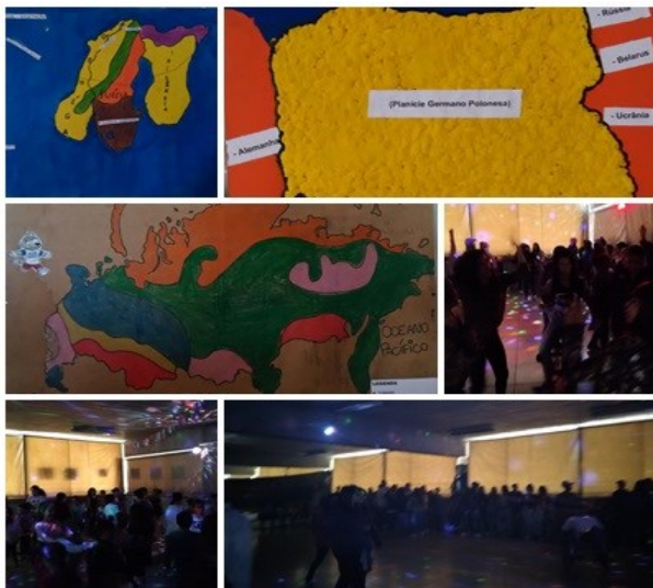
E.E. Min. Oscar Dias Correia