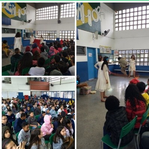
E.E. Prof. Jair Toledo Xavier