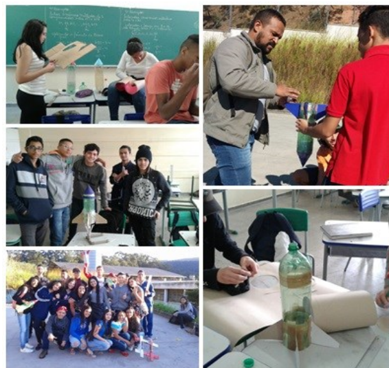
E.E. Profa. Maria Helena G. de Arruda