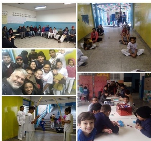
E.E. Profa. Zoraide de Campos Helú Atividades de Reposição