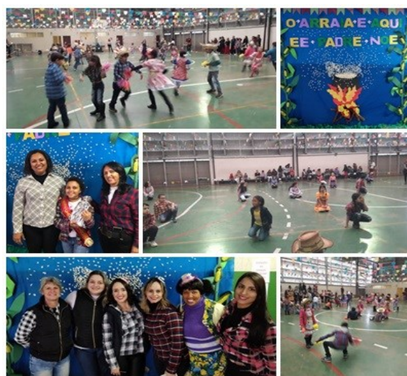
E.E. Padre Noé Festa Junina 2018