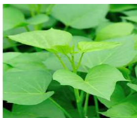
FOLHA DE BATATA-DOCE

Para o ano de 2018, o objetivo será resgatar e difundir sabedorias tradicionais a respeito das chamadas PLANTAS ALIMENTÍCIAS NÃO CONVENCIONAIS-PANC's, de forma a se diversificar e enriquecer a alimentação do aluno. As PANC's são caracterizadas pelo seu rápido crescimento, ótima adaptação climática, fácil dispersão, germinação e alta longevidade, mesmo em solos inadequados. Por tais características e por estarem naturalmente presentes ao nosso redor, são um símbolo da alimentação nutritiva e acessível a todos. São alguns exemplos de PANC's que são facilmente encontradas em nosso dia-a-dia, em quintais, jardins, dentre outros: